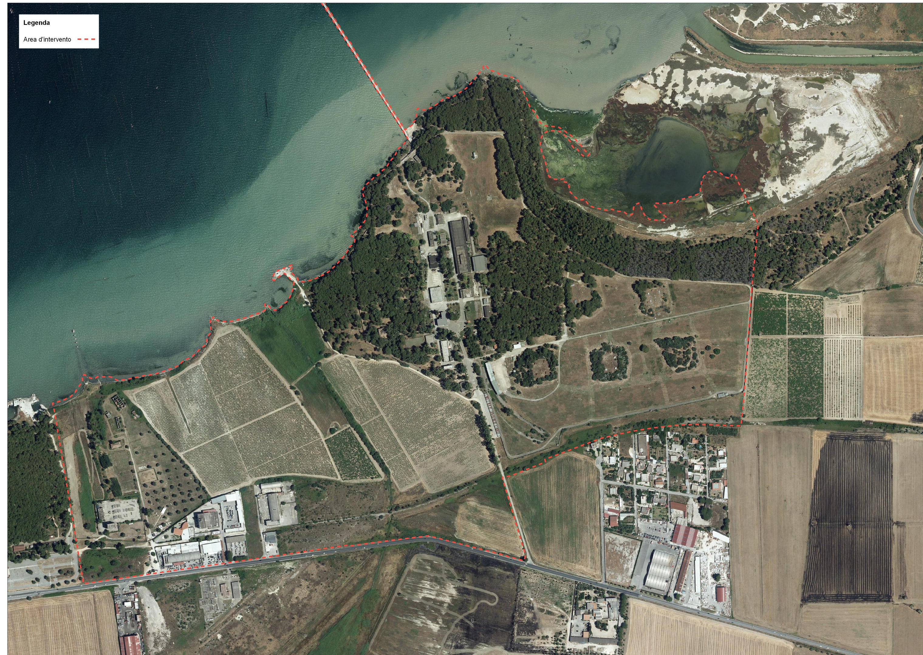
Inquadramento territoriale su ortofoto