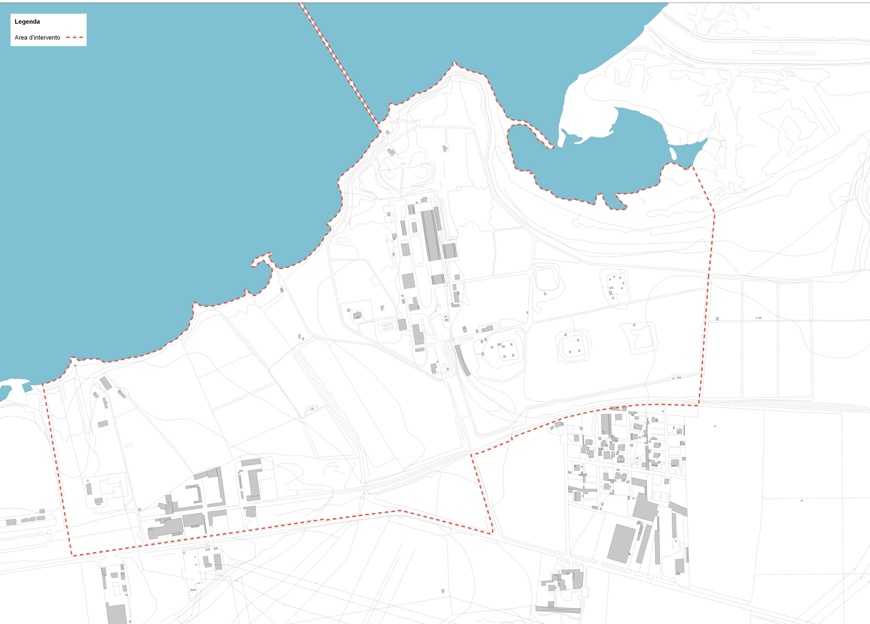
Inquadramento territoriale su cartografia aerofotogrammetrica